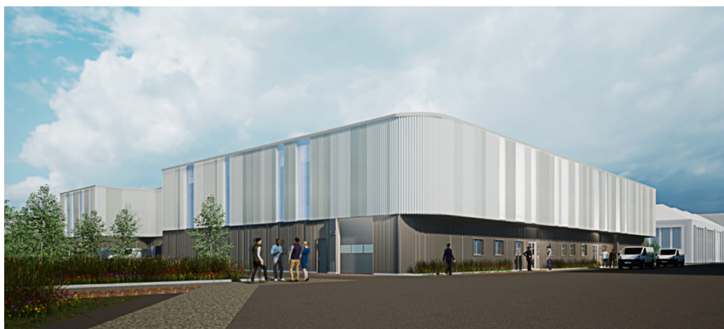
Vue Nord Ouest du futur lot 1 depuis l'entrée du site ©Ateliers 4+

Mais plus qu'un bâtiment fonctionnel, le lot 1 jouera également un rôle de marqueur architectural à l'entrée nord d'USIN, avec une façade alliant verticalité et légèreté, grâce aux bandes vitrées filantes et aux volumes arrondis qui créent des percées de lumière et des perspectives depuis la promenade paysagère.